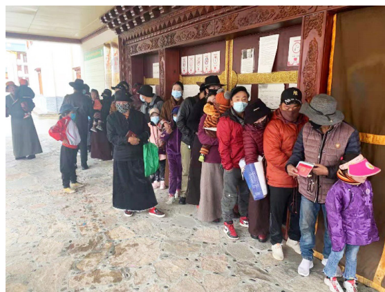
「醫佑童心」公益項目