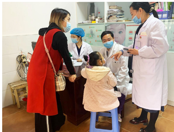
先心篩查公益活動在襄陽老河口市衛生院

同時，本集團亦成立了先健科技學術交流平台。本年度，平台共舉辦了19場海外醫生交流會議，與越南、泰國、馬來西亞、德國、俄羅斯、埃及、美國、印尼、歐洲等多國的醫生進行學術分享。而本集團亦照顧國內對結構性心臟病業務和外周血管病業務的需求。自主舉辦30+場線上學術會議，贊助20+場線下全國性大會等有關結構性心臟病的學術討論及活動；而外周血管病的學術討論及活動則主辦和參與了200+場線上／線下學術活動，通過50+衛星會／專題研討會和學術沙龍，30+場手術直播和錄播，25+科室產品宣講會和學習班等，向國內血管外科專家展示了先健科技全系列的外周產品，也為專家提供了高效、前沿的學術交流平台。