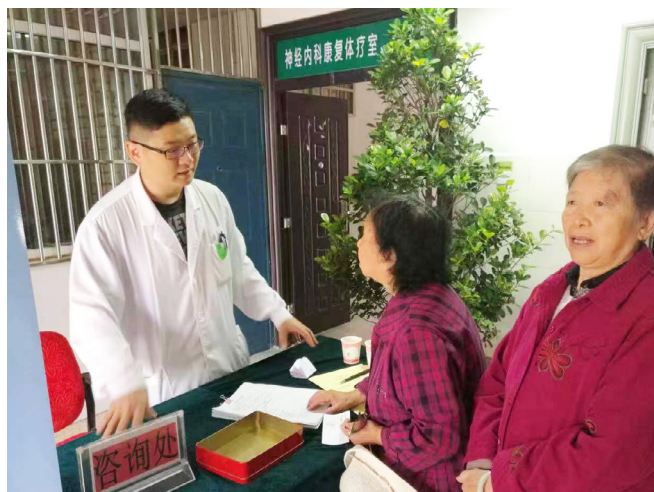
腹主動脈瘤篩查義診活動