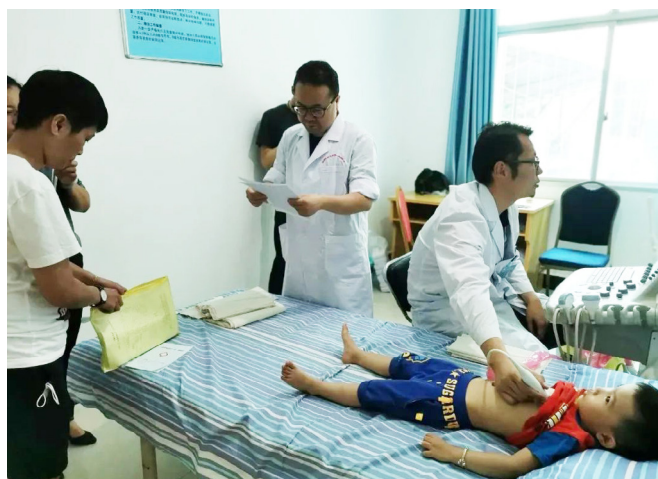
「希望心生命救助計畫」